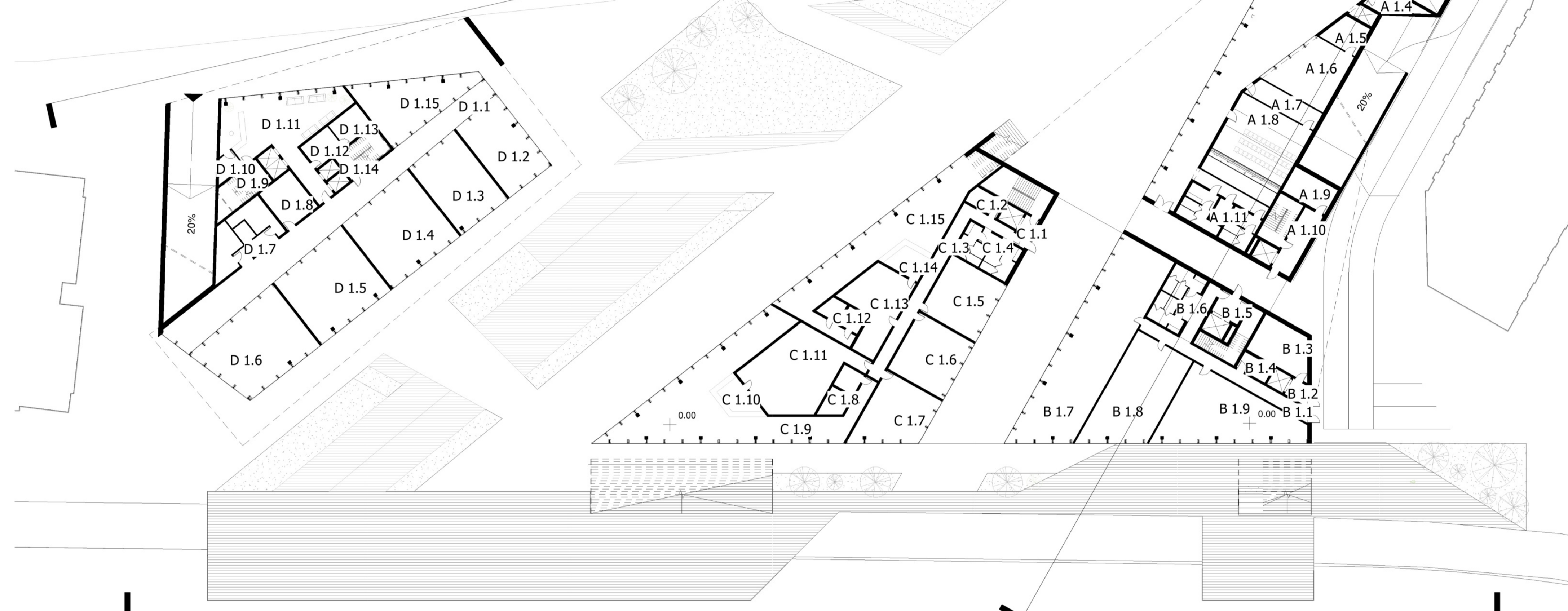
RZUT PARTERU 1:300