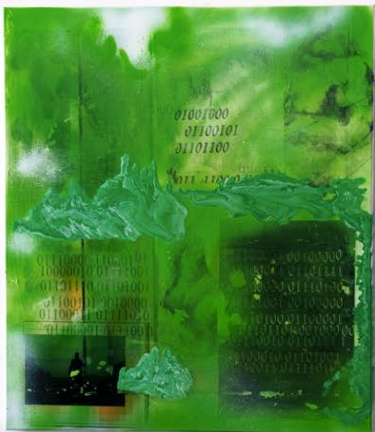
Strumień I , 90cm x 80cm, technika własna, 2022r.