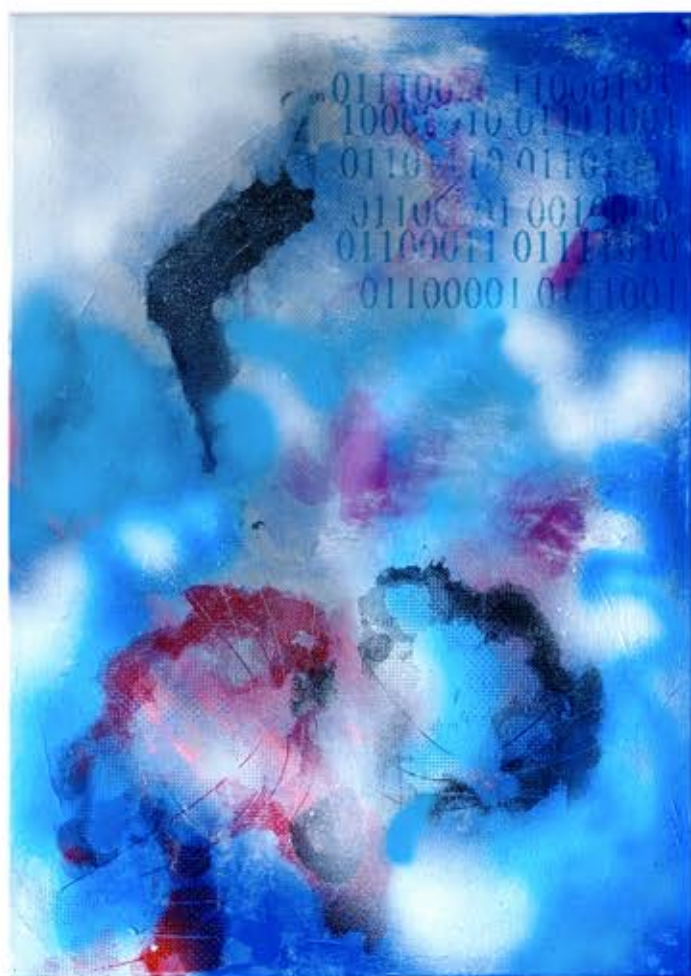
Chmura II , 70cm x 50cm, technika własna, 2022r.