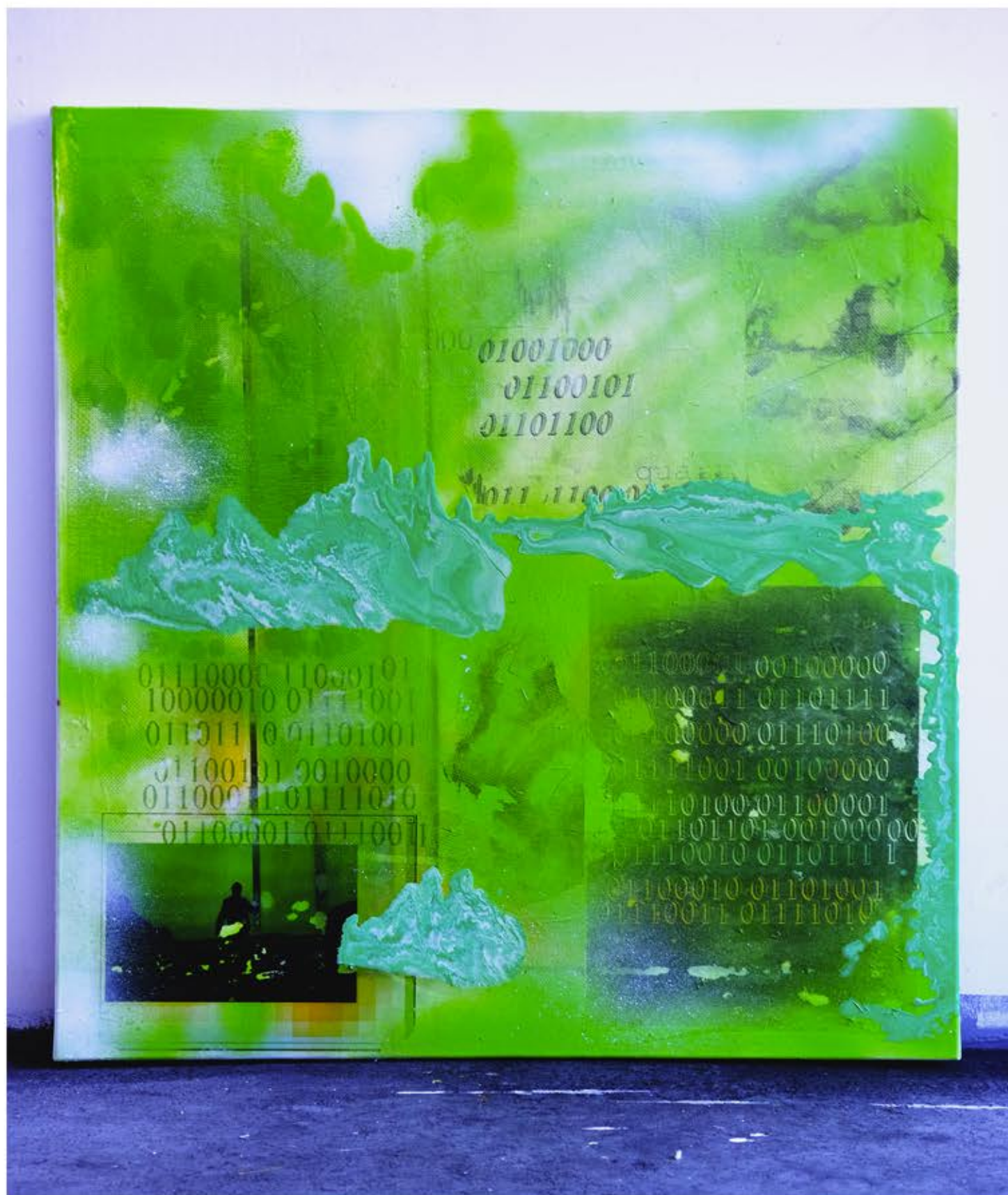
Strumień I, 90cm x 80cm, technika własna, 2022r.