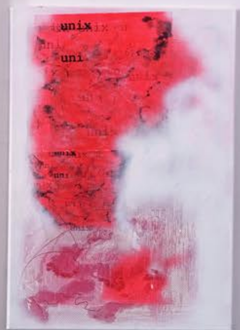
Chmura I , 68cm x 50cm, technika własna, 2022r.