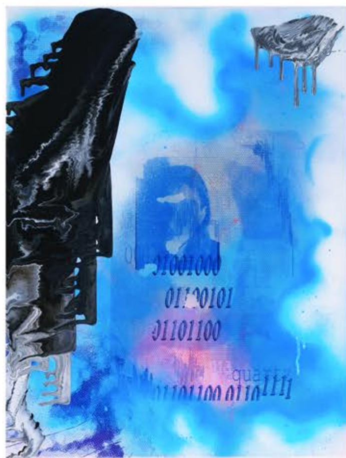
Strumień II , 65cm x 50cm, technika własna, 2022r.