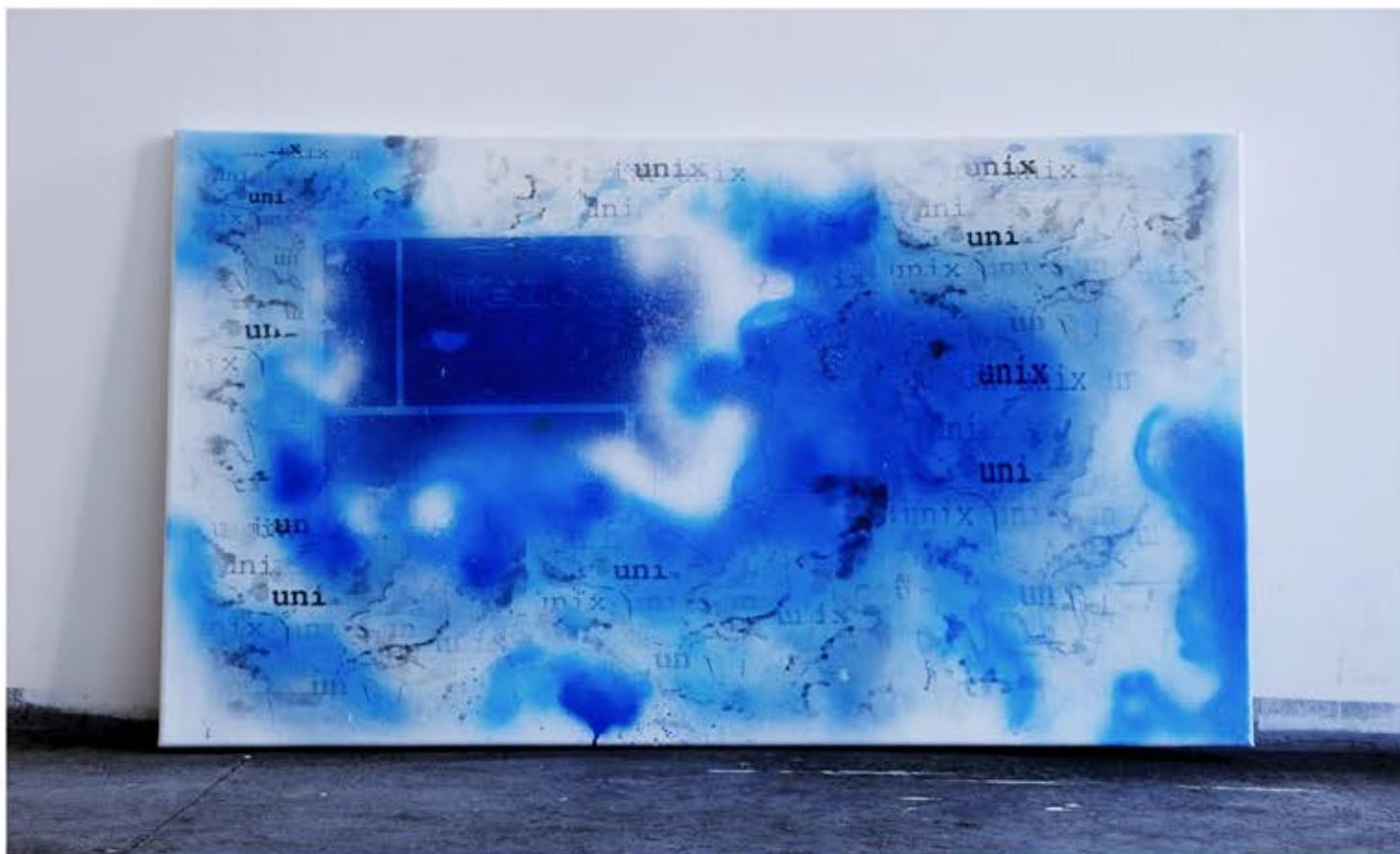
Unix time, 60cm x 100cm, technika własna, 2022r.