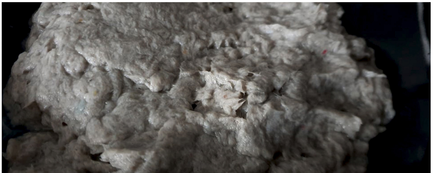
Odsączona masa papierowa poddawana barwieniu w dalszych etapach