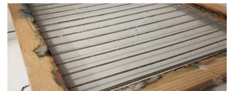
Zblendowana masa papierowa z dodatkiem krochmalu oraz forma do papieru