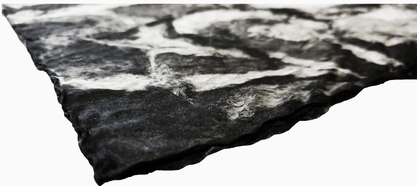
Praca z masy szarego i białego papieru z dodatkiem czarnego tuszu oraz chusteczek