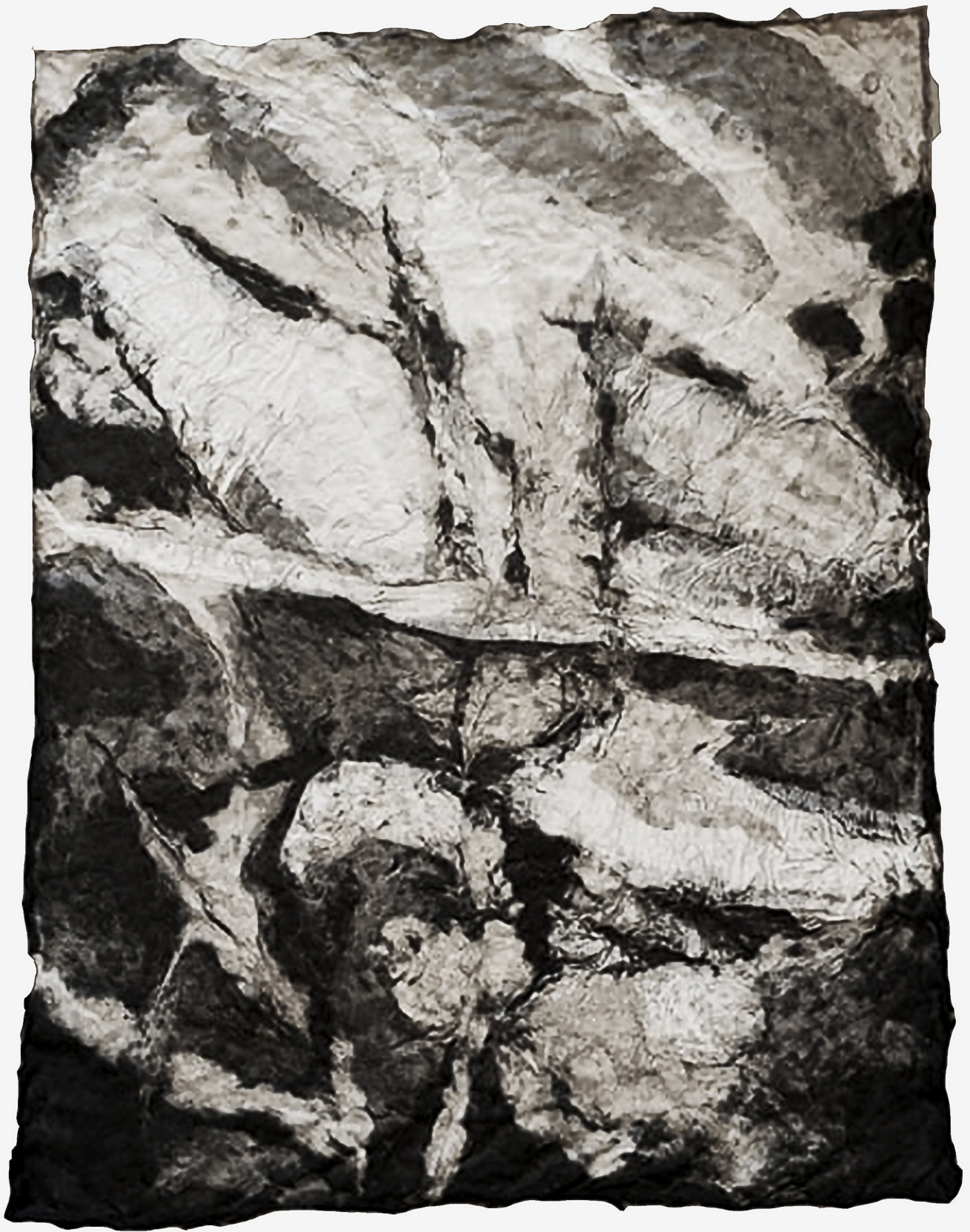
Praca z masy szarego i białego papieru z dodatkiem czarnego tuszu oraz chusteczek