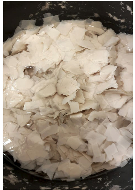
Dwa rodzaje masy papierowej - mieszanina białego i szarego papieru namoczonego w wodzie przez kilka dni