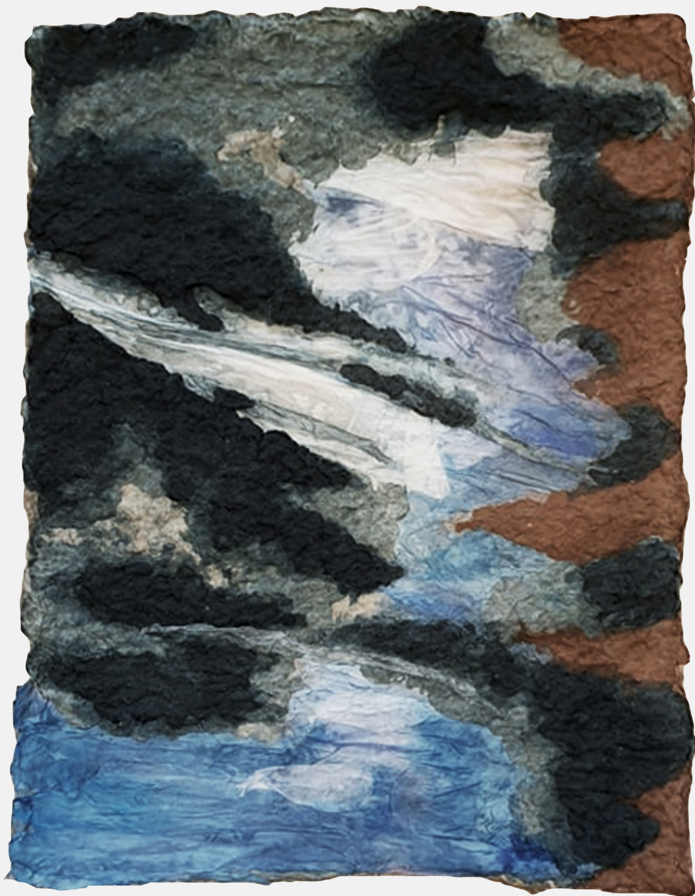
Praca z masy szarego i białego papieru oraz chusteczek, barwione akwarelami