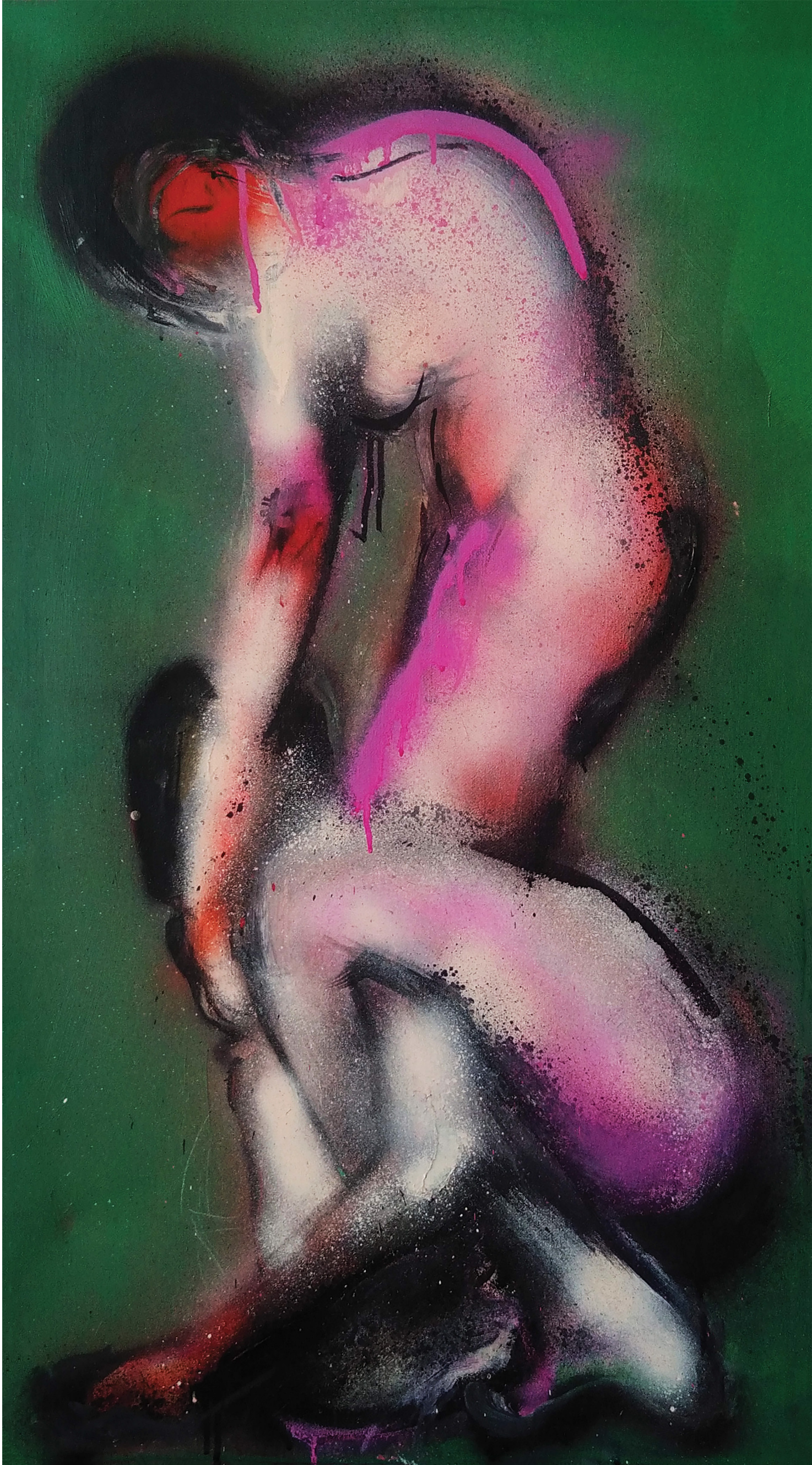
Bez tytułu, spreje akrylowe, 50x90cm, 2022