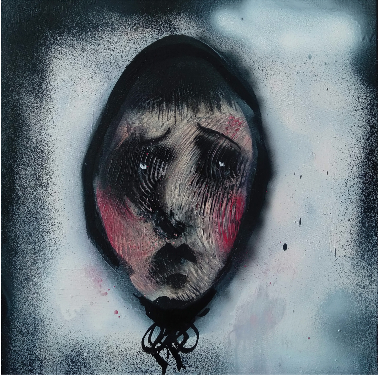
Bez tytułu, spreje akrylowe, 40x40cm, 2022