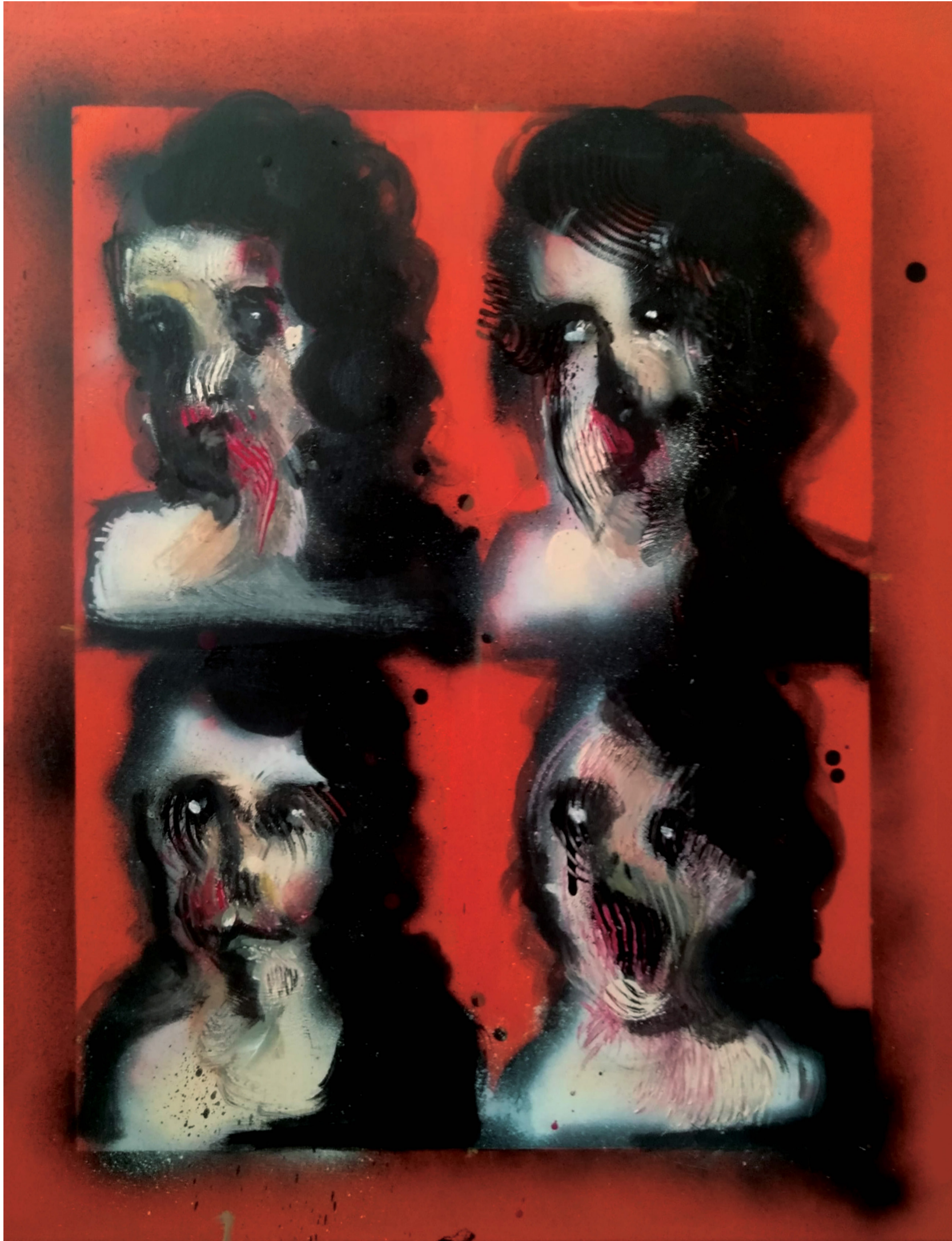
Dekonstrukcja mojej twarzy w 4 krokach, technika mieszana, 40x50cm, 2022