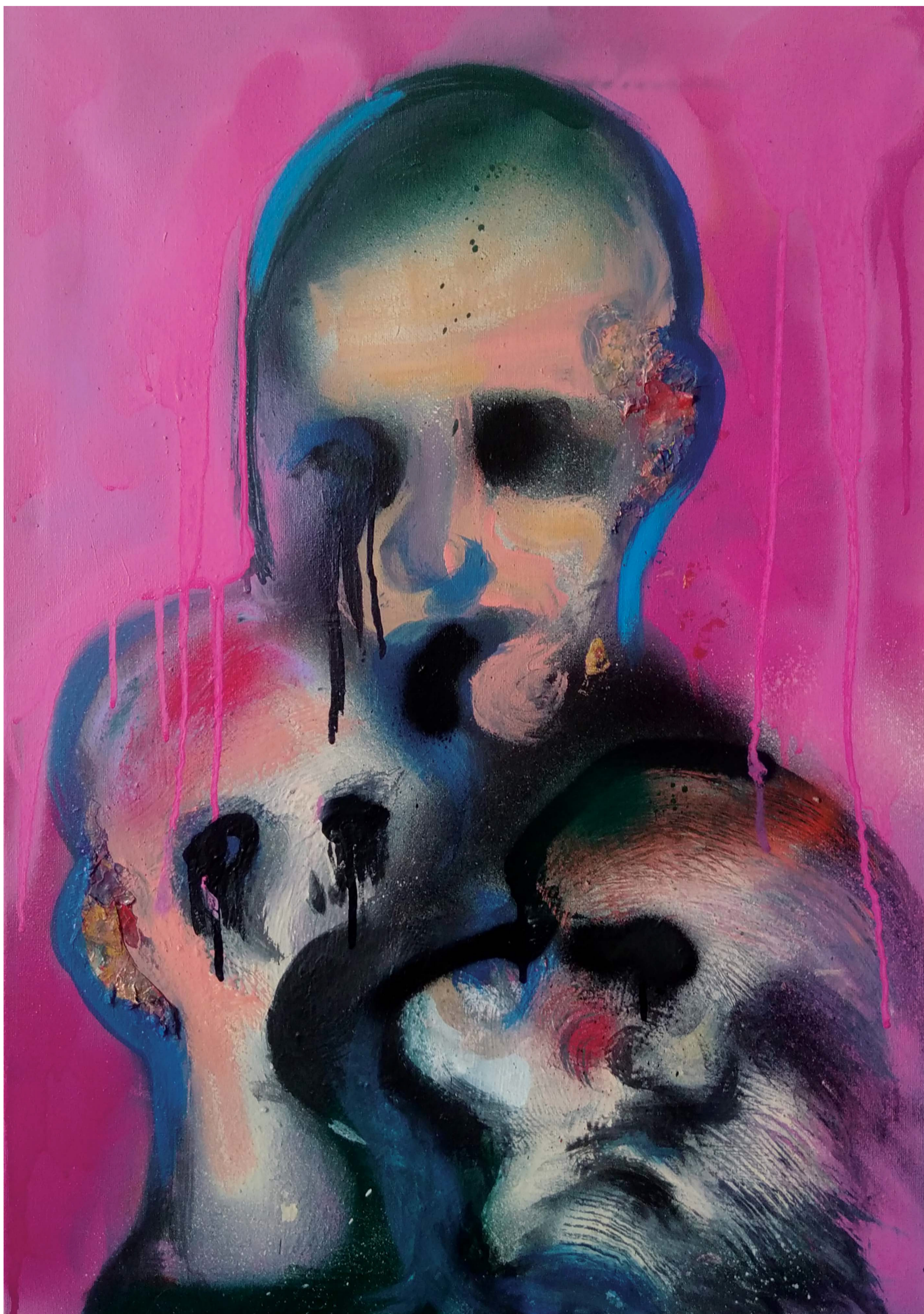
Bez tytułu, technika mieszana, 50x60cm, 2022