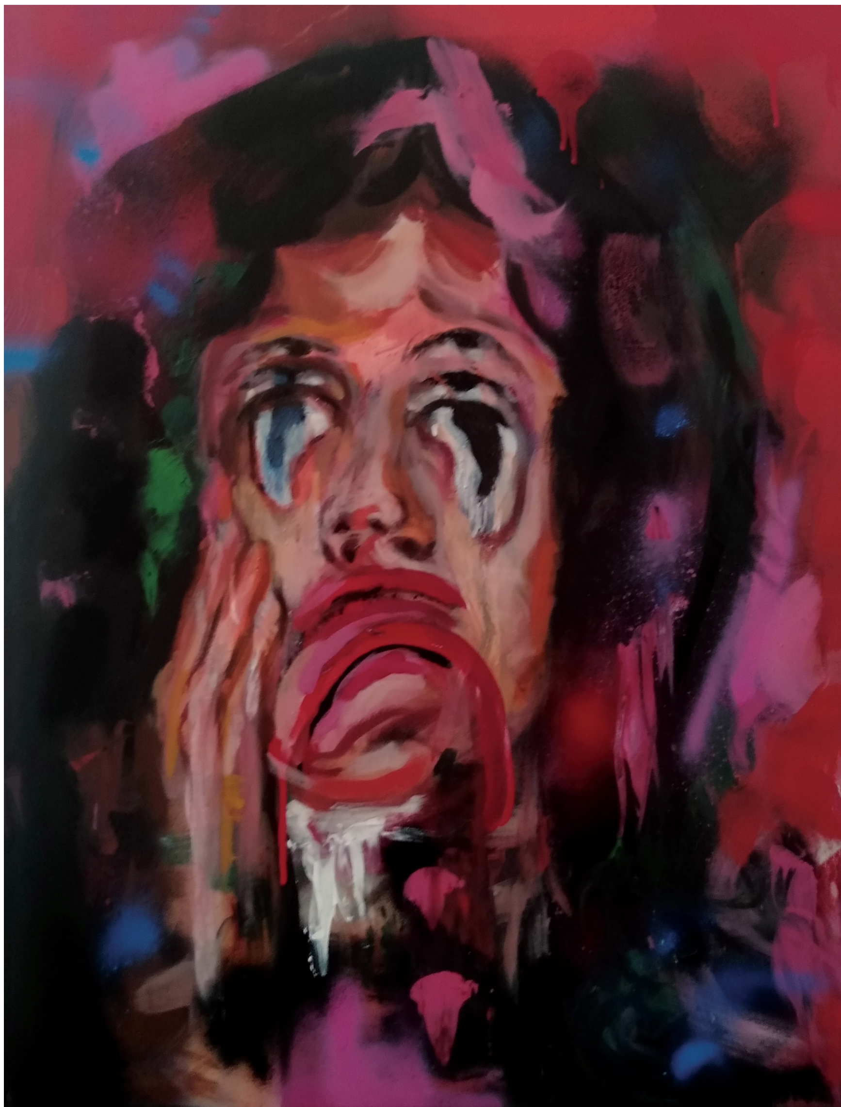
Bez tytułu, technika mieszana, 60x80cm, 2022