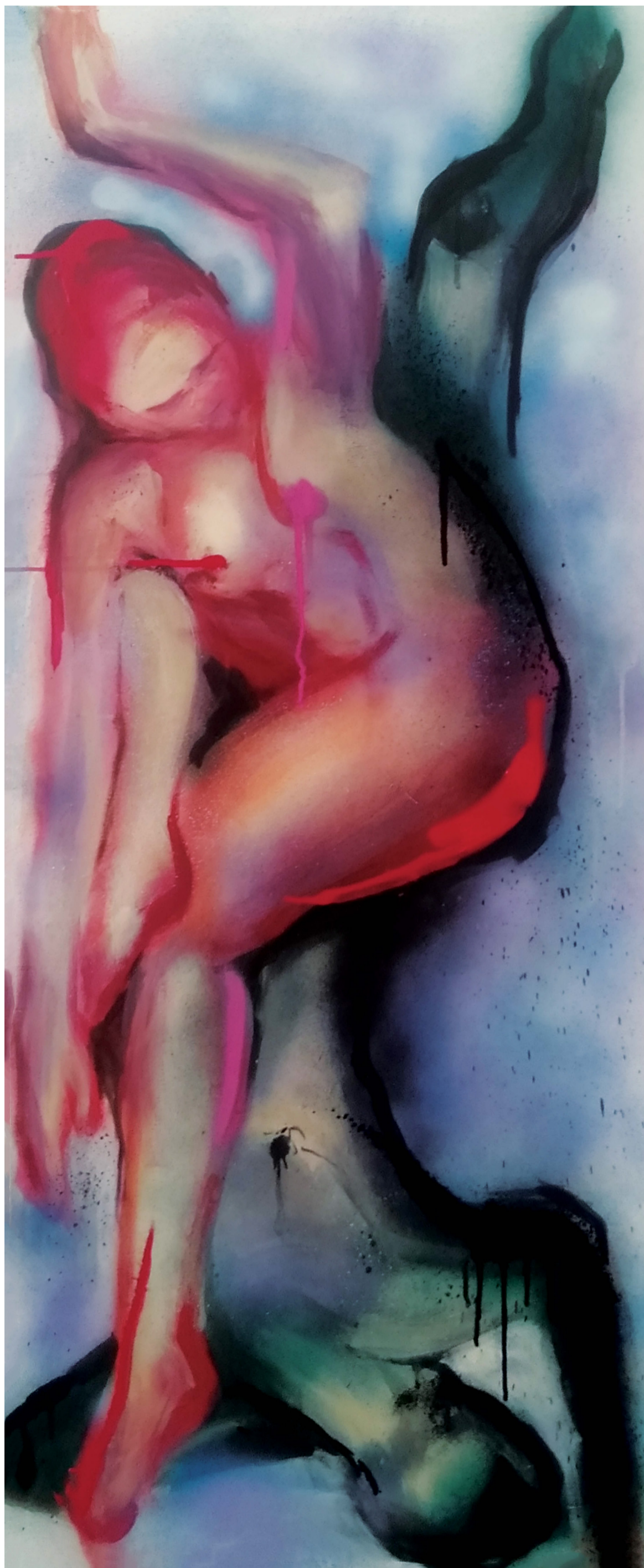
Bez tytułu, spreje akrylowe, 40x140cm, 2022