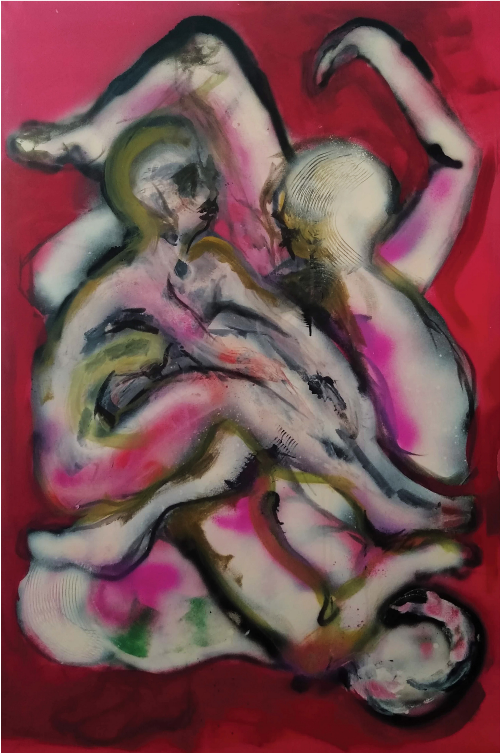
Bez tytułu, technika mieszana, 80x120cm, 2022